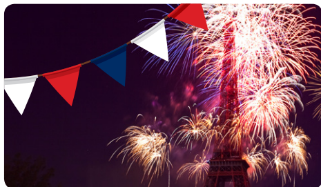
À Paris, le feu d'artifice est tiré depuis la Tour Eiffel et ses abords