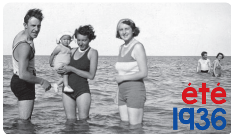
Beaucoup de familles découvrent la mer pour la première fois !