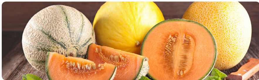
De gauche à droite : melon charentais, melon jaune d'Espagne et melon boule d'or