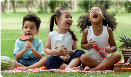
Déjeuner dans un parc : une façon simple de prendre le frais