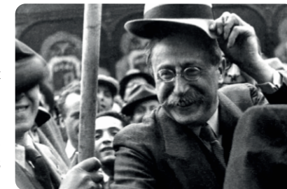
Léon Blum, leader des grandes réformes sociales de 1936

En 1936, après un mouvement de grève massif, les travailleurs, accompagnés par la CGT , obtiennent deux semaines de congés payés . C'est Léon Blum , alors chef du gouvernement du Front Populaire , qui négocie avec le patronnat à leurs côtés le 8 juin 1936 . Avant 1936, seuls les gens fortunés partaient en vacances. Pour la première fois cet été-là, des familles ouvrières ont pu découvrir la mer ou la montagne tout en étant payé, c'était un miracle ! Afin de rendre les vacances accessibles, Léo Lagrange , sous-secrétaire d'État aux loisirs et aux sports, a négocié avec les compagnies de chemin de fer des trains spéciaux à -60 %, accordé des aides aux auberges de jeunesse, etc. L'apparition des loisirs pour tous a été l'une des plus belles réussites du Front populaire.