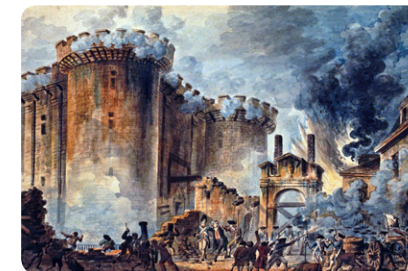
La prise de la Bastille par Jean-Pierre Houël (1735-1813)

Cette semaine, c'est le 14 juillet , notre fête nationale ! Une fête nationale, c'est le jour où un pays célèbre un événement qui a changé le cours de son histoire. En France, nous commémorons le 14 juillet 1789 : le début de la Révolution française . Les Français, en pleine crise économique et sociale, se révoltent alors contre le Roi Louis XVI . Ce jour-là, une foule de révolutionnaires s'empare d'abord du stock d'armes des Invalides puis se dirige vers la Bastille Saint-Antoine où elle se saisit par la force des réserves de poudre . Cet événement précipitera la chute du Roi. Tous les 14 juillet, nous célébrons la République et ses valeurs dans la plupart des communes par des défilés, des bals populaires et, bien sûr, par l'incontournable feu d'artifice !