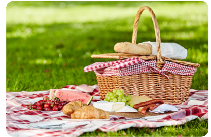
Quelques fruits, du pain et du fromage suffisent

Rien de tel qu'un pique-nique en plein air pour prendre le frais. Inutile d'aller très loin : un bord de rivière, un coin de pelouse ou même un parc en bas de chez soi suffisent pour changer de cadre et permettre aux enfants de se défouler . Côté menu ? Il n'est pas nécessaire de se compliquer la vie en cuisinant : du bon pain, un morceau de fromage ou de charcuterie, une tomate à croquer, quelques fruits de saison et le tour est joué. Si vous avez plus de temps pour préparer, une salade composée d'une base de féculents (riz, pâtes, quinoa, pommes de terre...), de crudités et d' œufs durs , par exemple, peut à elle seule constituer un repas sain et équilibré . Au Syrec, l'été est parsemé de repas froids basés sur ce modèle, comme celui servi le mardi 28.