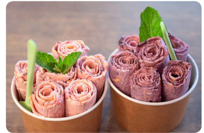
En Thaïlande, la glace se roule en jolis copeaux gourmands

Quand on pense glaces du monde , la première citée est la glace à l'italienne . Or son nom est trompeur car elle aurait été inventée... aux États-Unis, dans les années 1930 ! Elle avait alors l'avantage d'être plus légère pour les nombreux vendeurs ambulants. Les véritables glaces italiennes sont les gelati . Proches de nos crèmes glacées, elles sont plus légères car elles ne contiennent traditionnellement que du lait. En Sicile, la fameuse granita , glace pilée au sucre et au jus de citron, est très rafraîchissante. On retrouve ce genre de granite en Amérique du Sud sous le nom de rapsadilla ou shikashika . Dans un genre très différent, on peut citer les mochis glacés japonais, les ice rolls de Thaïlande, etc... En tous cas une chose est sûre : c'est toujours bon !