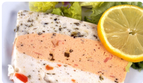
La terrine se mange froide, avec une mayonnaise, par exemple