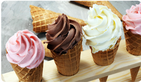
Malgré son nom trompeur, la glace à l'italienne... ne l'est pas !